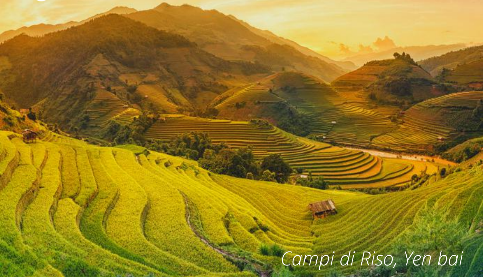
Campi di Riso, Yen bai